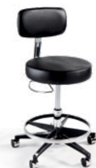
Le modèle 277 de la série Classic est illustré avec 15 cm (6") de hauteur supplémentaire (laboratoire) et d'un anneau repose-pieds.