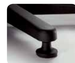
Patins (série Value)