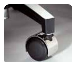
Roulettes en caoutchouc souple (série Classic)