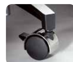
Roulettes de blocage (séries Classic et Value)