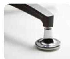
Patins (série Classic)