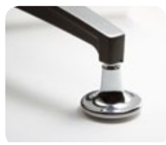
Patins (série Classic)