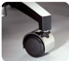
Ruedas de goma blanda de la serie Classic