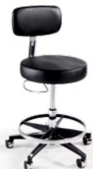
La serie Classic 277 con las opciones de extensión de altura de 15,24 cm (6") y reposapiés circular.