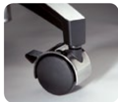
Ruedas bloqueables de las series Classic y Value