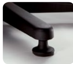
Pies deslizantes de la serie Value