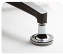
Pies deslizantes de la serie Classic