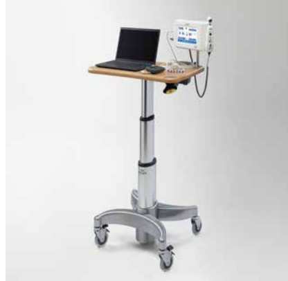
POSTE DE TRAVAIL 6215 POUR LES INTERVENTIONS