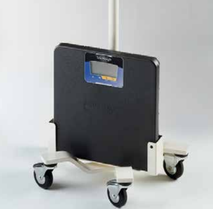
SUPPORT DE PESAGE FAIRBANKS®