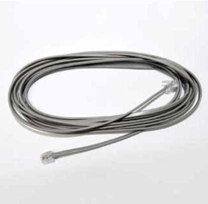
CÂBLE SÉRIE DE BALANCE NUMÉRIQUE (DE 4,57 M OU 15 PI) MIDMARK