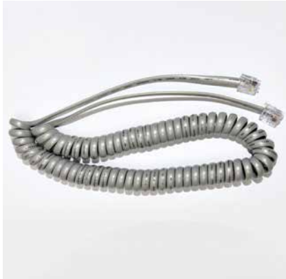
CÂBLE SÉRIE DE BALANCE NUMÉRIQUE (DE 18 CM OU 6 PI) MIDMARK