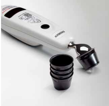
CAPUCHONS JETABLES POUR THERMOMÈTRE EXERGEN®