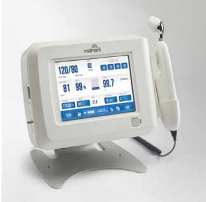
SUPPORT DE COMPTOIR