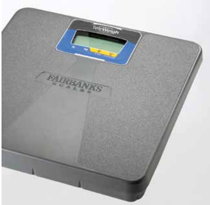
PÈSE-PERSONNE NUMÉRIQUE FAIRBANKS® TELEWEIGH™