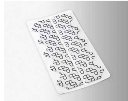
ÉLECTRODES ECG JETABLES