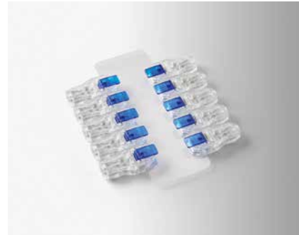
CLIPS ECG TRANSPARENTS