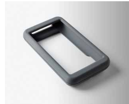
HOUSSE EN SILICONE