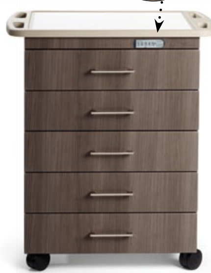
Con cubierta con asas en los bordes

Midmark es una empresa certificada según las normas ISO 13485 e ISO 9001.