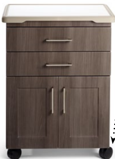
Con cubierta con bordes suaves acolchados