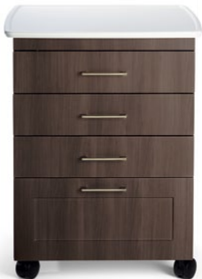
Con cubierta Kydex® con bordes redondeados